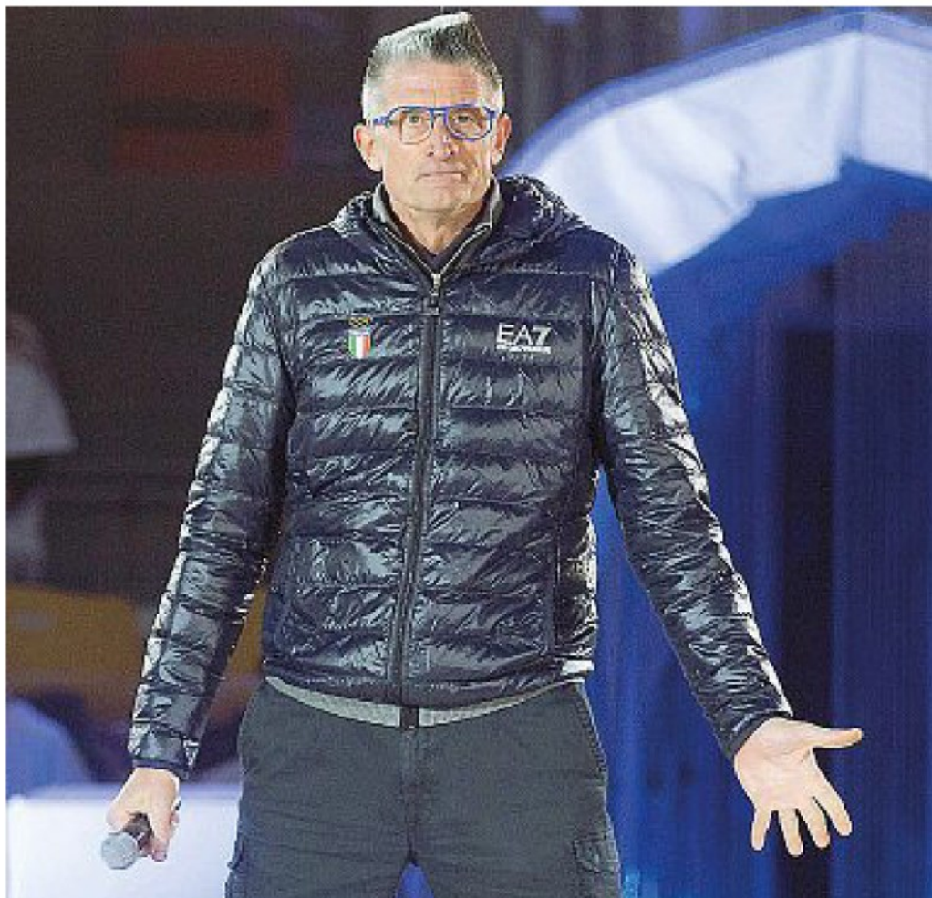
Numero uno Andrea Lucchetta con la Nazionale ha vinto Mondiale, Europeo e tre World League consecutive