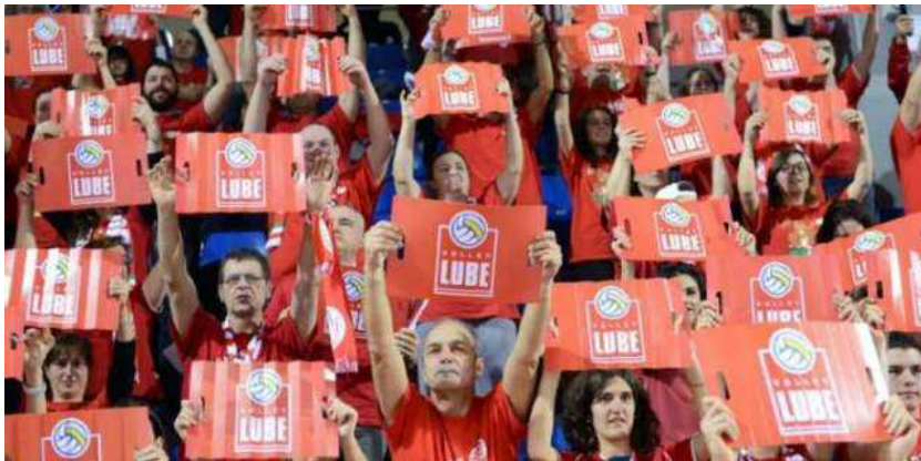
Tifosi della Lube

L'Itas Trentino vince in rimonta Gara 3 della semifinale play off con la Cucine Lube Civitanova , dopo quasi tre ore di gioco sempre ad alta tensione.