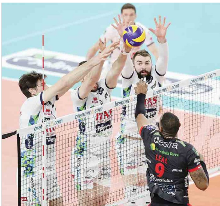
Il muro dell'Itas su Leal. Lunedì il fondamentale ha funzionato bene: 16 block (TRABALZA)